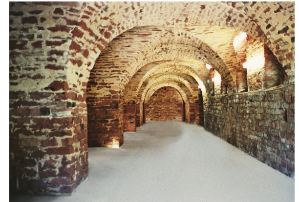
7_Gewölbekeller Schloss Fechenbach