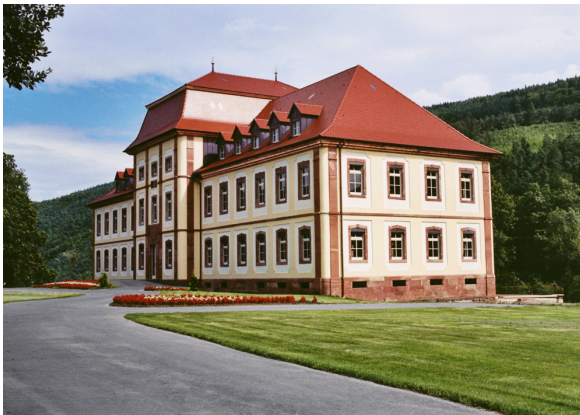
2_Außenansicht Schloss Fechenbach