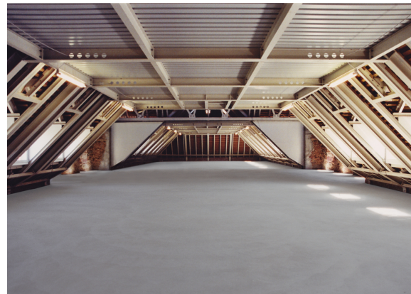
6_Innenansicht Schloss Fechenbach_2