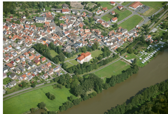
12_IMG_9240 Collenberg 06092010