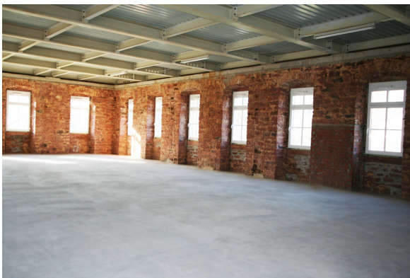
5_Innenansicht Schloss Fechenbach